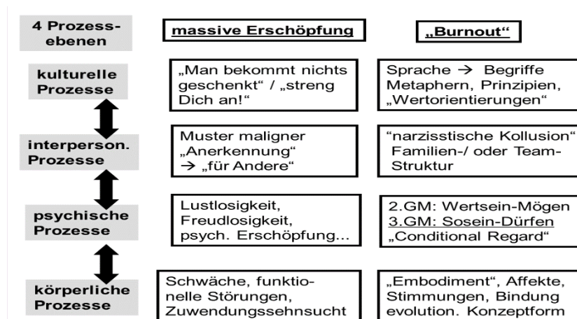
Abbildung: Die vier Prozessebenen am Beispiel des „Burnout“: die linke Spalte enthält eher erlebensnahe Begriffe und Erklärungen, die rechte Spalte verweist eher auf die damit verbundenen (theoretischen) Konzepte (aus EXISTENZANALYSE 35/2/2018, S. 51).

Dass alle vier Ebenen berücksichtigt werden müssen, wird schon an einem vergleichsweise einfachen und alltäglichen Phänomen deutlich, das sich auf der psychischen Ebene als „längerdauernde Erschöpfung, Lustlosigkeit und Überforderung“ beschreiben lässt – und dem wir als Beobachter (und meist inzwischen auch als Selbst-Beobachter!) die Bedeutung „Burnout“ zuweisen. Die Abbildung (Kriz 2018) zeigt, dass neben der Beschreibung/Erklärung auf der psychischen Prozessebene auch Einflüsse der anderen Prozessebenen eine erhebliche Rolle spielen – wie die „Verstärkung“ dieses Musters durch andere, die davon profitieren, oder die Leid/t/sätze als der Familienbiographie (und diese wiederum aus der Kultur), aber auch eine Eigendynamik, die durch permanente Überforderung entstanden ist und bei der dann tatsächlich auch körperlich „nichts mehr geht.“ Es sei beachtet, dass in der rechten Spalte u.a. auf „Konzepte“ der EA (2. Grundmotivation/3. Grundmotivation) verwiesen wird, welche den Leser:innen ebenfalls vertraut sein sollte.